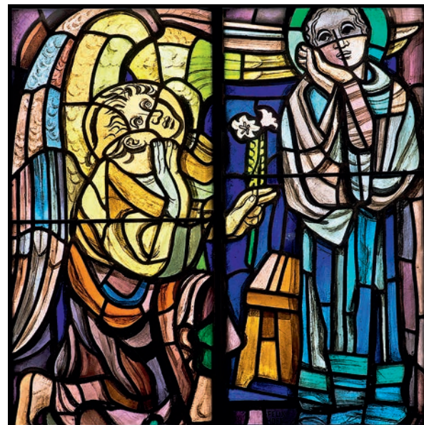
«Die Verkündigung an Maria» in der Stadtkirche Aarau

Im Chor findet sich das zentrale Fenster mit einer Darstellung der Auferstehung (1961) mit den Massen 350 x 102 cm. Farblich entwickelt sich