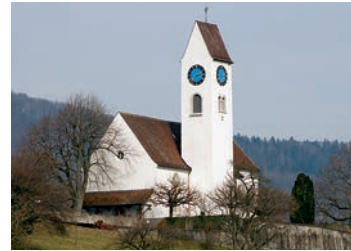
Kirche Kirchberg (Küttigen)