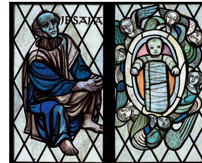
«Die Vision des Jesaja» in der Kirche Kirchberg